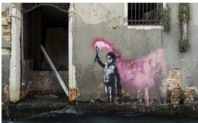
Venezia – Maggio 2019

Ha fatto il giro del mondo l'immagine dell'opera Girl with a Balloon , venduta per la cifra straordinaria di 953mila sterline a fronte della quotazione massima di 300mila e distrutta da Banksy durante la ormai mitologica asta Sotheby's. Un nuovo video racconta come è stata realizzata la performance. Banksy mostra la propria arte su superfici pubblicamente visibili. Non vende fotografie o riproduzioni dei suoi graffiti di strada, ma è noto che i banditori d'aste cercano di vendere la sua arte di strada sul posto e lasciano il problema della sua rimozione nelle mani dell'offerente vincitore.