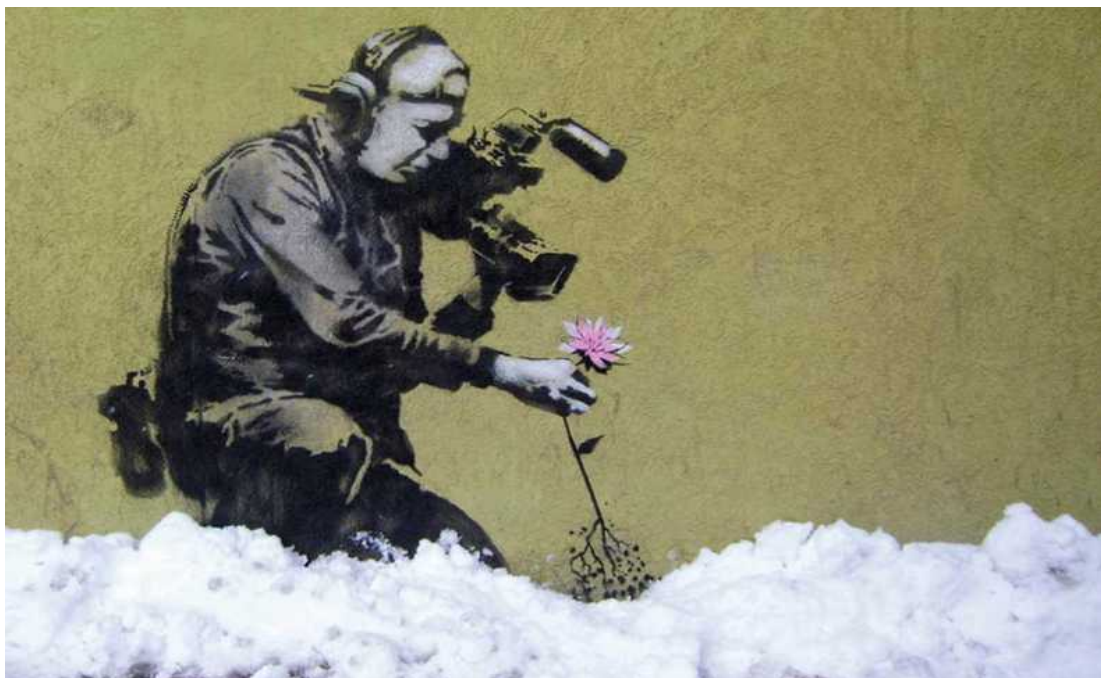
Park City – Utah (USA)

Se ami un fiore non raccoglierlo. Perché se lo raccogli muore e cessa di essere ciò che ami. Quindi se ami un fiore lascialo dov'è. L'amore non è possesso. L'amore è piacere. Osho